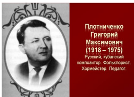
Плотниченко Григорий Максимович (1918 – 1975) Русский, кубанский композитор. Фольклорист. Хормейстер. Педагог.

В соавторстве со многими композиторами Кубани и России С. Хохлов написал около шестидесяти песен. Песня «Кубанские синие ночи» на музыку Г. Плотниченко стала визитной карточкой и музыкальной эмблемой Краснодарского края.