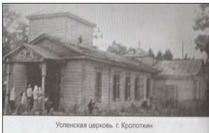
Успенская церковь. г. Кропоткин

В 1887 году была построена деревянная Успенская церковь на месте хлебной ссыпки греческих купцов (по улице Красной, где сегодня расположены здания узла связи и милиции). 6