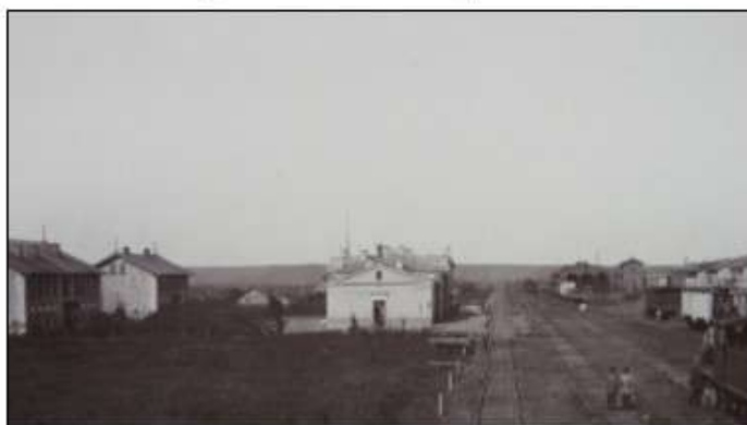
Железнодорожная станция Кавказская 1875 год

Вокруг станции Кавказская стал быстро расти железнодорожный поселок, заселяемый семьями железнодорожных рабочих, торговцев и казаков станицы Кавказской, а также большей частью иногородними, которые приезжали сюда в поисках работы и обосновывались здесь на всю жизнь.