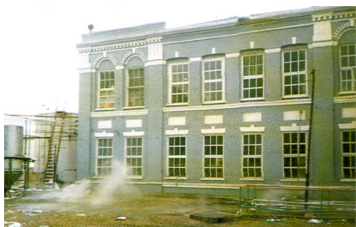
Здание цеха очистки масла