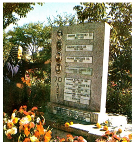
Братская могила воинов, погибших при освобождении города Кропоткина 31 января 1943 года

На памятнике табличка: «Памятник объект культурного наследия регионального значения. Братская могила советских летчиков, погибших в боях с фашистскими захватчиками 1942-1943 гг. Охраняется государством».