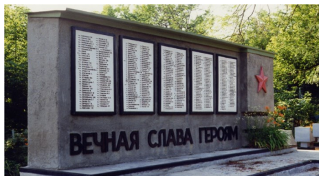
Памятник погибшим воинам при защите и освобождении города Кропоткина от немецко-фашистских захватчиков

Есть в Кропоткине памятные места, овеянные солдатской славой 1941-1943 годов, где благодарные потомки склоняют головы перед светлой памятью защитников города Кропоткина и воинов погибших при освобождении города, вновь и вновь восстанавливая в памяти события тех дней.